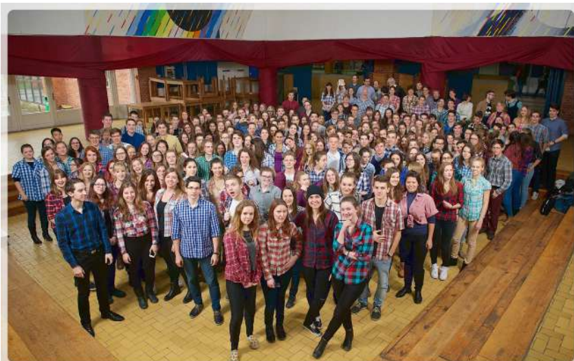
Karinthy Frigyes Gimnázium • 2015-2016

ság megjelenését az iskolákban, a gyerekek eszközként való használatát, a pedagógusi és szülői befolyást. Kérdésként merült fel: Mennyire engedi és támogatja a felnőtt társadalom, hogy a gyerekek saját véleményét alakítsanak ki? Milyen mértékben tanítja meg őket az érvek és ellenérvek megismerésének fontosságára, a vitakultúrára? Segíti-e őket abban, hogy kiálljanak magukért és érdekeikért?